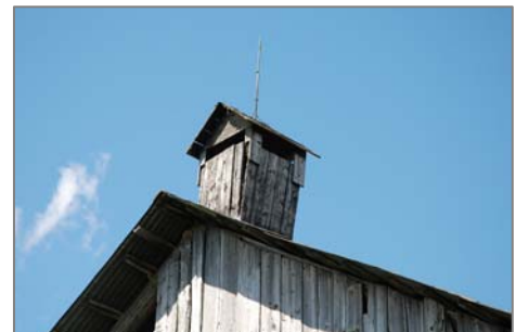
Évent sur le point de tomber qui demande une intervention pour sa remise en état.