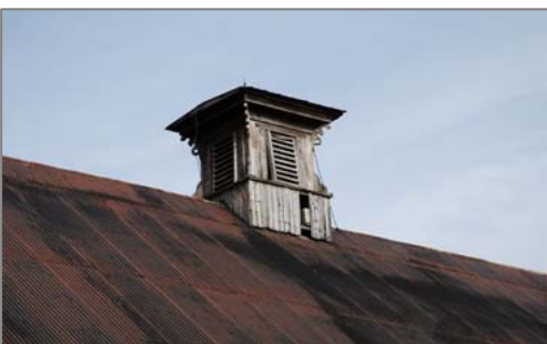
Campanile mal en point qui a besoin d'une restauration.