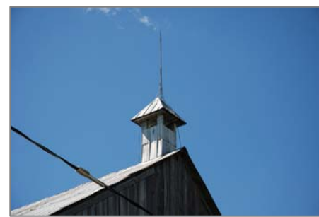
Paratonnerre installé sur un événement

Inventé par Benjamin Franklin au 19 e siècle, le paratonnerre est destiné à protéger les bâtiments des effets de la foudre. Les bâtiments agricoles, essentiellement en bois, sont particulièrement vulnérables aux incendies causés par les éclairs. Ces structures surélevées sont les premières touchées lors d'orages. Les tiges métalliques, installées sur les campaniles et lanterneaux, sont reliées au sol afin de diriger les décharges électriques vers la terre,