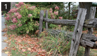
Clôture de perches