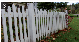
Clôture de bois

Photos : 1.Coaticook 2.Coaticook 3.Compton