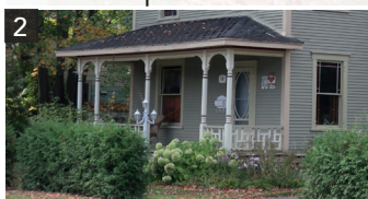
Haie de cèdres